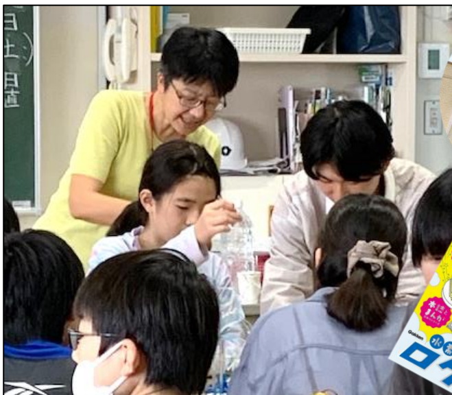
「水素エネルギーロケット」教材

2024年10月19日(土)は、滝野川小学校で開催された「第19回北区環境展」に参加しました。昨年までは、校庭のテントでの展示でしたが、今年は「出前授業」に初挑戦、6年生3クラスを受け持ちました！